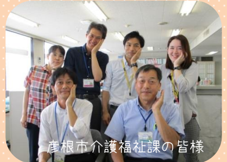
彦根市介護福祉課の皆様