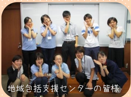
地域包括支援センターの皆様