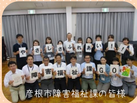
彦根市障害福祉課の皆様